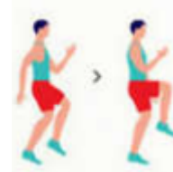
Corrida estacionária (30 segundos)